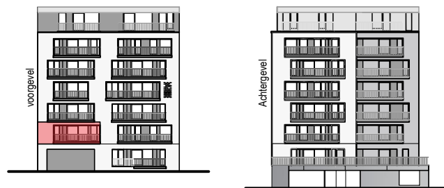
Gevelaanzicht Sand Dune