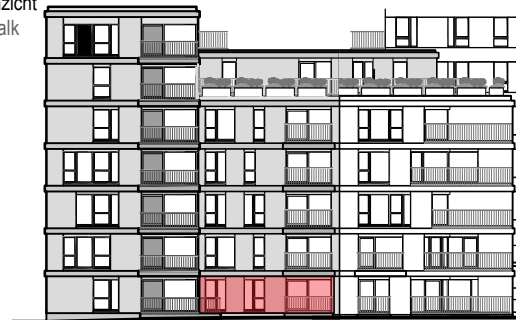
Gevelaanzicht Beach Walk