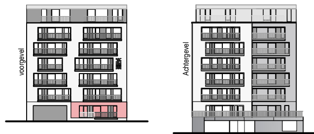
Gevelaanzicht Sand Dune